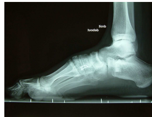
Radiographie à 3 mois

Astuce : la fixation n'est pas nécessaire. Cependant, le greffon ne peut pas être traversé par un matériel d'ostéosynthèse ; l'association avec des agrafes ou une plaque vissée est impérative.